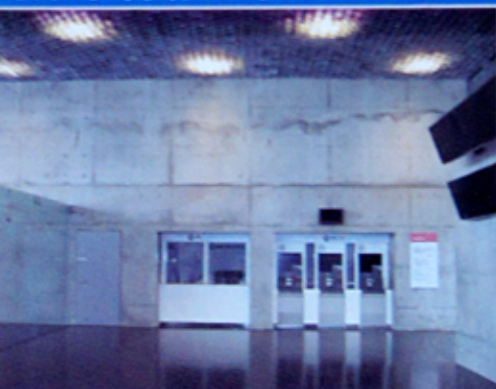
1F/オープンスペース