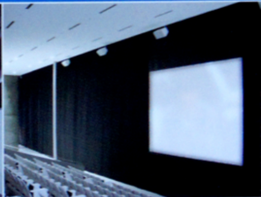
3F/サイクルシアター(スクリーン)