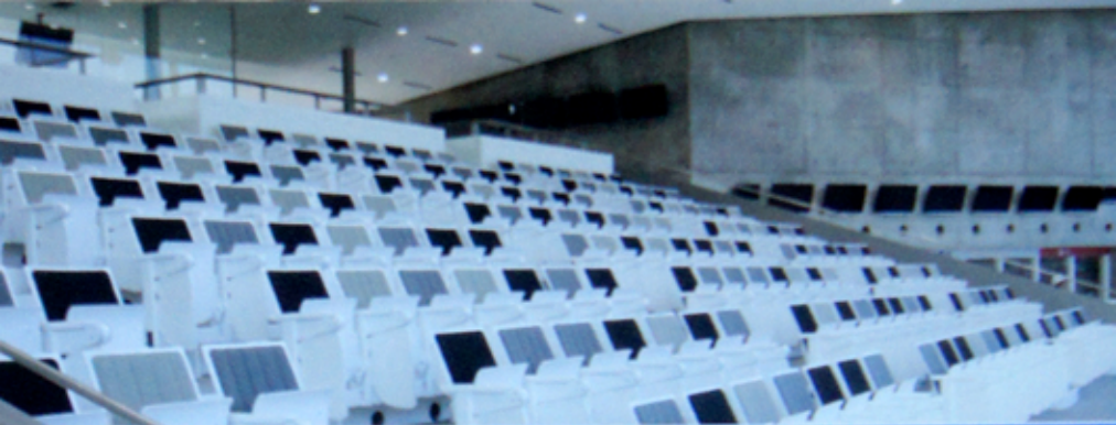
3F/サイクルシアター